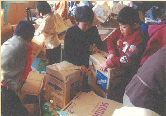
環境リサイクル講師による授業（段ボールの再利用）