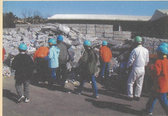
3R学習体験（回収アルミ缶リサイクル工場の見学）