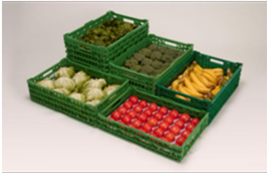
リターナブルコンテナのラインナップ