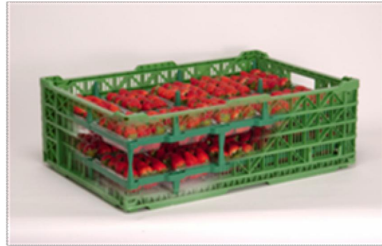
イチゴ用リターナブルコンテナ