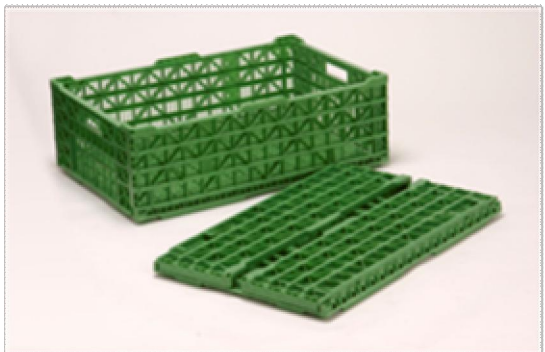
組立て・折畳み状態のリターナブルコンテナ