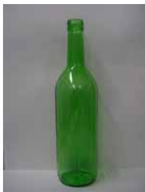
酒びん (エコロジーボトル)