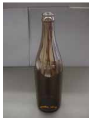
ビールびん (写真のみ)