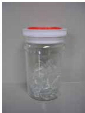
無色カレット (再生材料)