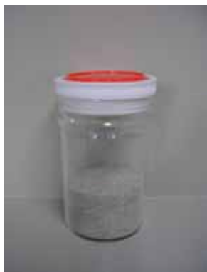
珪砂 (ガラスびんの原料)