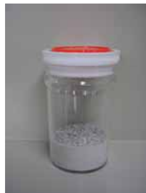
石灰石 (ガラスびんの原料)