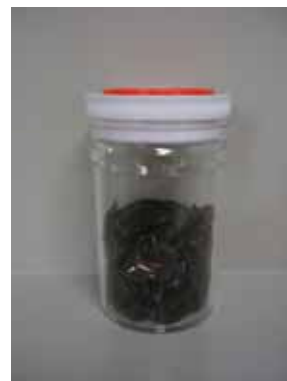
茶色カレット (再生材料)