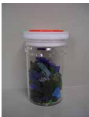
混合カレット (再生材料)