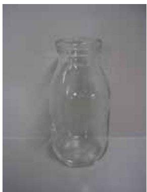
牛乳びん (軽量びん)