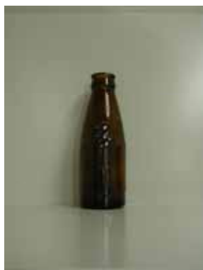
ドリンクびん (写真のみ)