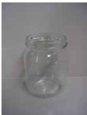
ジャムびん (超軽量びん)