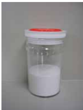
ソーダ灰 (ガラスびんの原料)