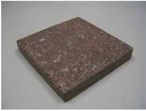
舗装ブロック（再生品の例）