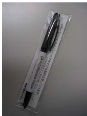
③ボールペン（再生品の例）