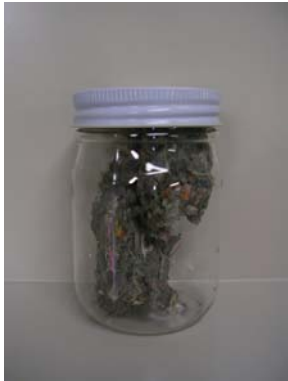
⑯減容成形品（ガス化）