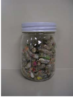
⑭造粒物（高炉還元剤）