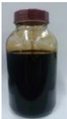
原油（プラスチックの原料）（写真のみ）