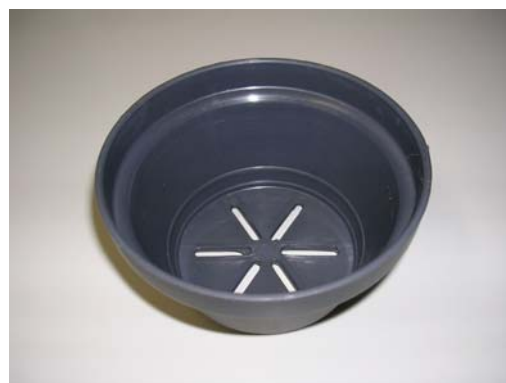
⑨植木鉢（再生品の例）