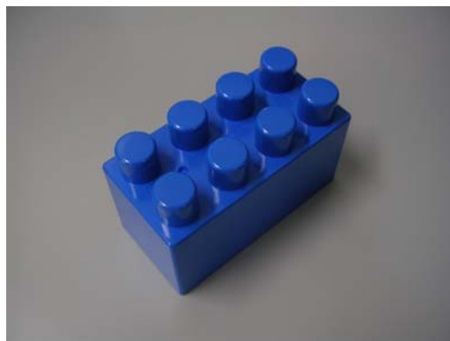
④ブロック（再生品の例）