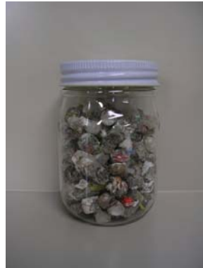
⑰RPF（プラスチック固形燃料）