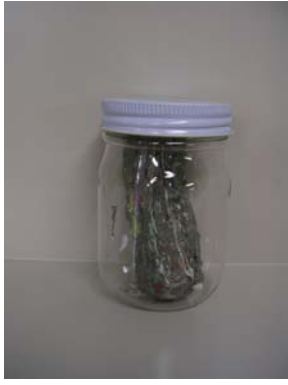
⑪造粒物（コークス炉化学原料）