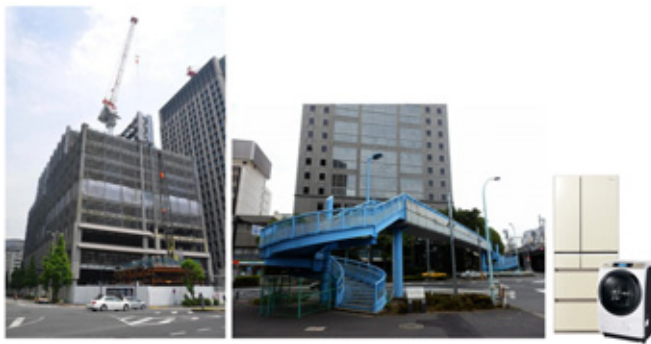
ビルの鉄骨・鉄筋、橋、家電製品（再生品の例）（写真のみ）