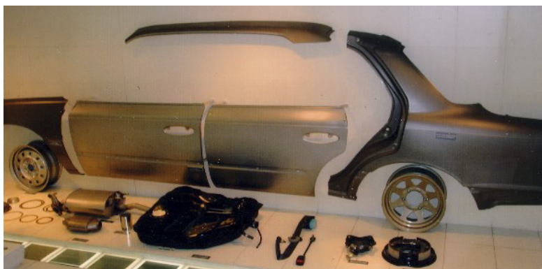
自動車部品（再生品の例）（写真のみ）