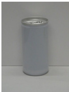
スチール缶（印刷前）