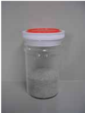
珪砂 (ガラスびんの原料)