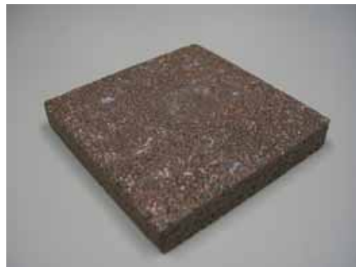
舗装ブロック (再生品の例)