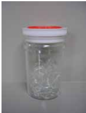
無色カレット (再生材料)