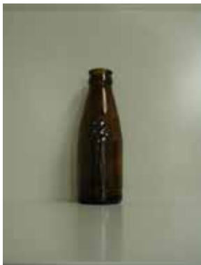
ドリンクびん (写真のみ)