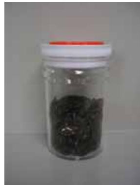
茶色カレット (再生材料)