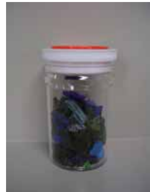
混合カレット (再生材料)