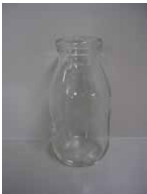
牛乳びん (軽量びん)