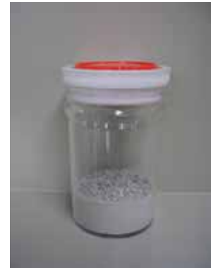
石灰石 (ガラスびんの原料)